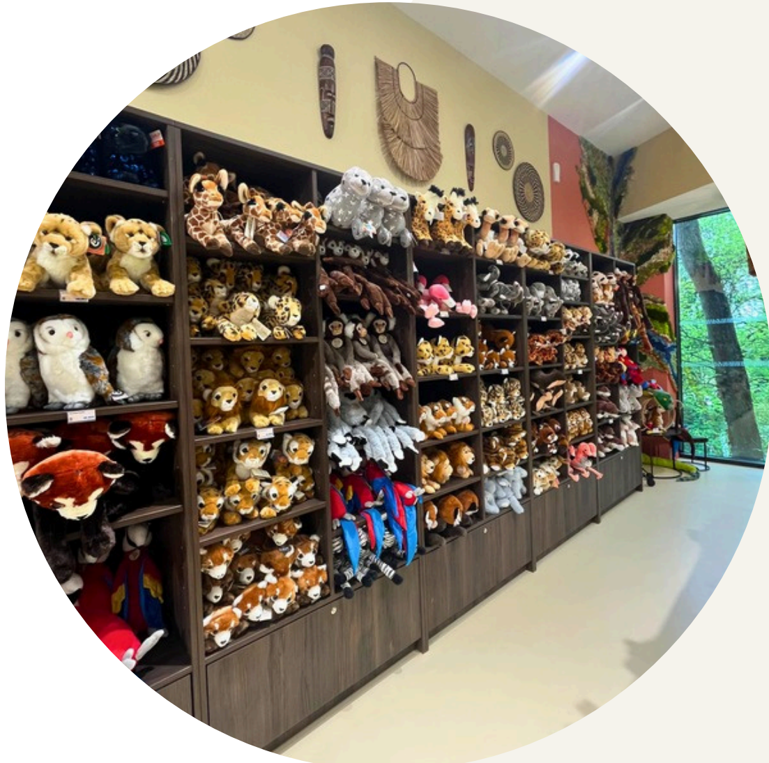
Boutique du ZOO African Safari.