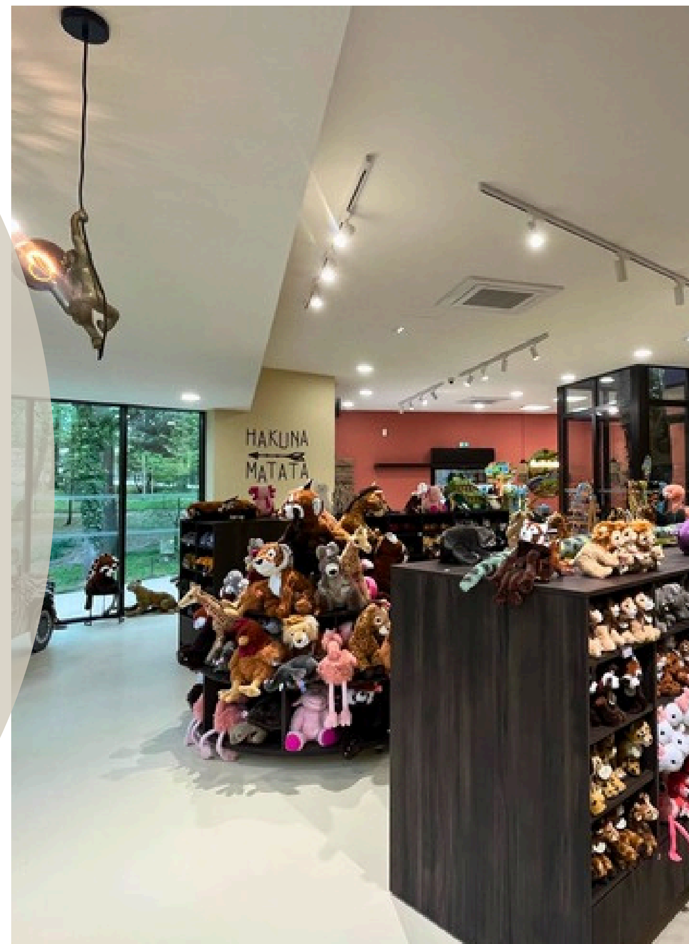
Boutique du ZOO African Safari.

Architecture d'intérieur • Décoration • Merchandising stratégique